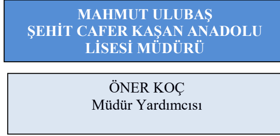
Tablo 3: Okul Çalışanları Mevcut Verileri